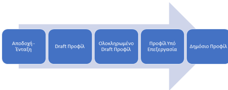
Διάγραμμα 1: Διαδικασία δημιουργίας και δημοσίευσης εταιρικού προφίλ.

Το σύστημα αρχικά δημιουργεί αυτόματα ένα κενό προφίλ για την εταιρεία και αρχικοποιεί το όνομα με το όνομα που έχει καταχωρήσει ο χρήστης στην αίτηση. Το προφίλ της εταιρείας μπαίνει σε κατάσταση draft, δηλαδή σε κατάσταση ολοκλήρωσης και παραμένει στην κατάσταση αυτή μέχρι να συμπληρωθούν όλα τα σχετικά υποχρεωτικά πεδία (βλ. πίνακας 1).